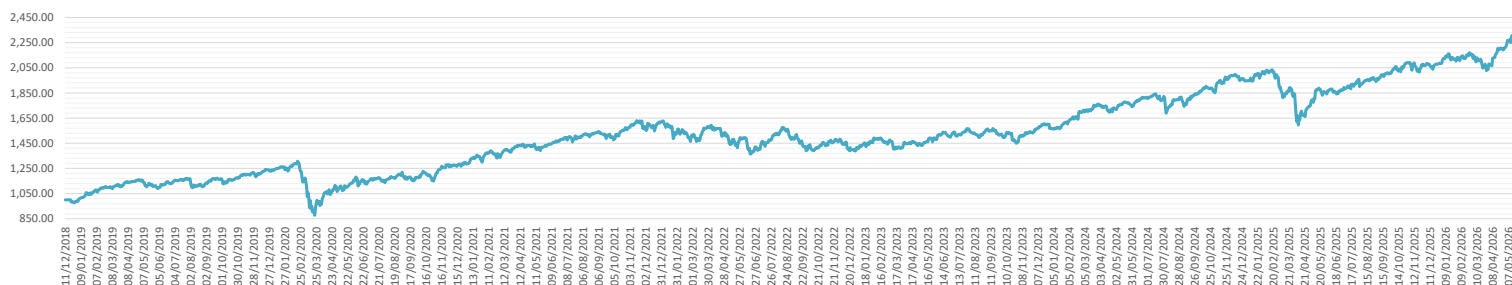
Evolution valeur d'unité