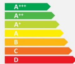
Old energy label